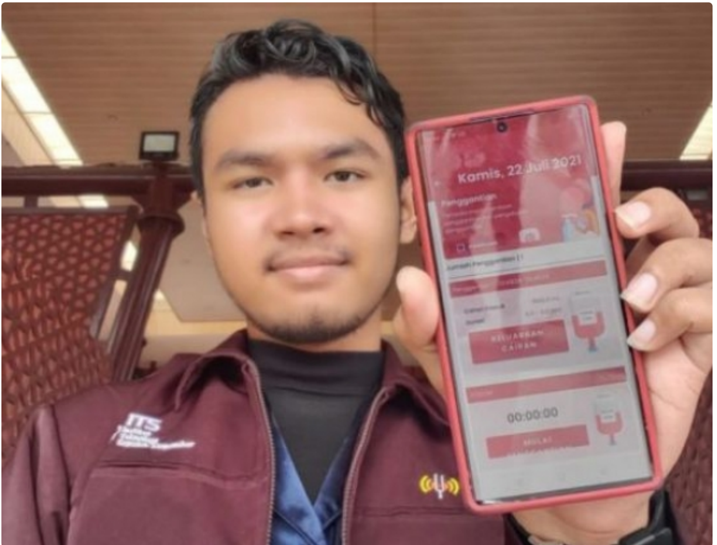
Foto : Tampilan aplikasi SahabatCAPD karya tim mahasiswa ITS untuk bantu pasien Gagal Ginjal Kronis (GGK).

SURABAYA - Pasien Gagal Ginjal Kronis (GGK) yang menggunakan metode Continuous Ambulatory Peritoneal Dialysis (CAPD) seringkali menemui masalah self-monitoring yang berakibat komplikasi. Guna mengatasi masalah tersebut, mahasiswa Institut Teknologi Sepuluh Nopember (ITS) ciptakan aplikasi