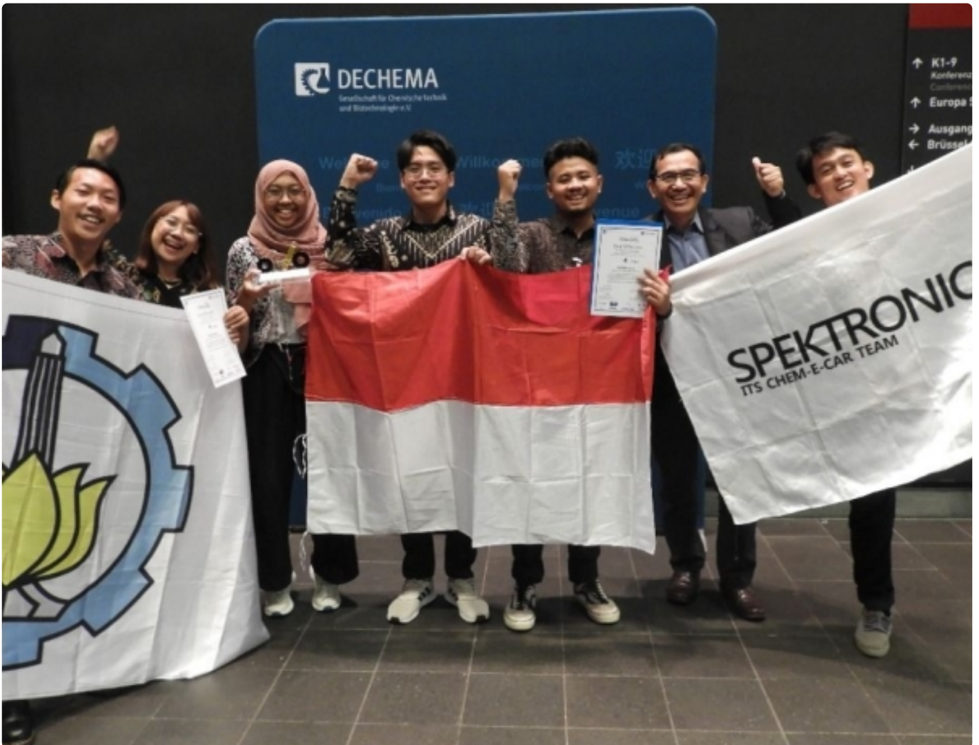
Tim Spektronics ITS Berjaya Jadi Juara Chem-E-Car di Jerman

SURABAYA – Mahasiswa Institut Teknologi Sepuluh Nopember (ITS) tak henti-hentinya menorehkan prestasi membanggakan internasional melalui bidang riset dan inovasi. Setelah tahun lalu berhasil meraih juara II, kali ini tim Spektronics ITS sukses menduduki podium di posisi pertama atau juara I pada ajang Chem-E-