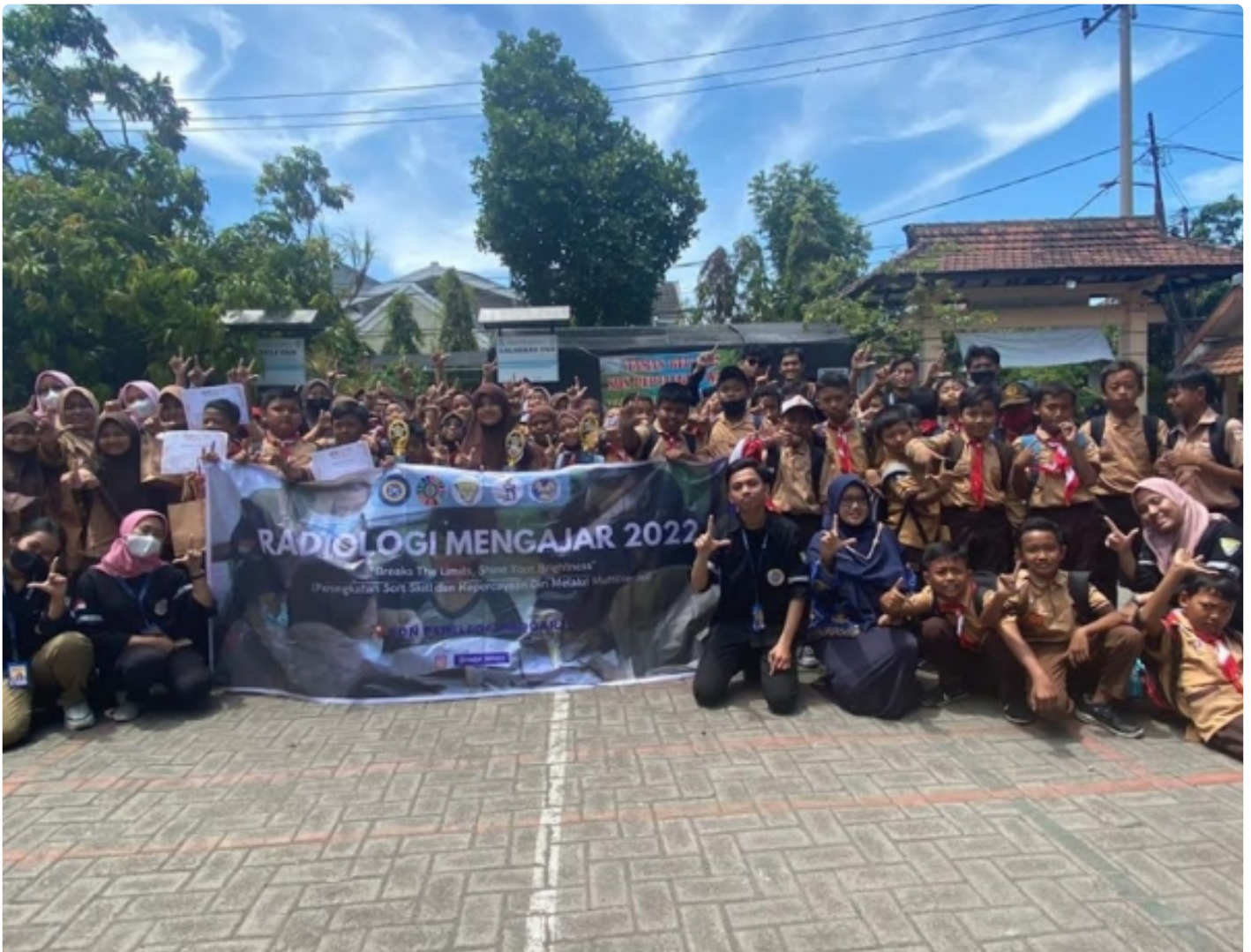
Foto bersama panitia dan siswa SDN Pepelegi 2 Sidoarjo dalam acara Radiologi Mengajar 2022

SURABAYA – Rendahnya minat literasi di Indonesia yang masih minim mendorong Divisi Pengabdian Masyarakat dan Lestari Lingkungan Himpunan Mahasiswa D4 Teknologi Radiologi Pencitraan Fakultas Vokasi (FV) Universitas Airlangga (UNAIR) melaksanakan kegiatan Radiologi Mengajar 2022. Bertempat